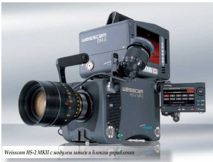
Weisscam HS-2 MKII с модулем записи и блоком управления

Модуль для режима Rental (ориентирован на прокатные компании) дает возможность модифицировать Weisscam HS-2 MKII в соответствии с потребностями клиентов. Это повышает эффективность сдачи камеры в аренду. Клиенты могут выбрать один из трех различных комплектов настроек в зависимости от своих задач. Предоставляя различные наборы функций для разных приложений, таких как фантастическое кино, реклама, телесериалы и т.д., прокат-