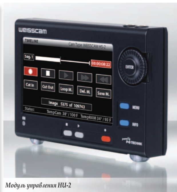
Модуль управления HU-2